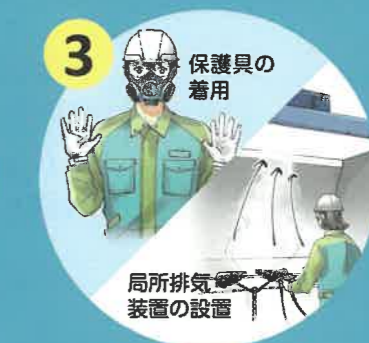
リスク低減措置の実施