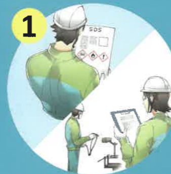
SDS及び作業現場の確認

これまで以上に事業者の主体的な取組が求められます ラベル・SDSの伝達やリスクアセスメントの実施がこれまで以上に重要になります