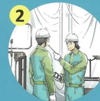
リスクアセスメントの実施