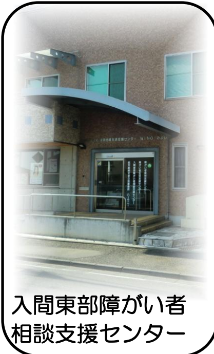
入間東部障がい者 相談支援センター