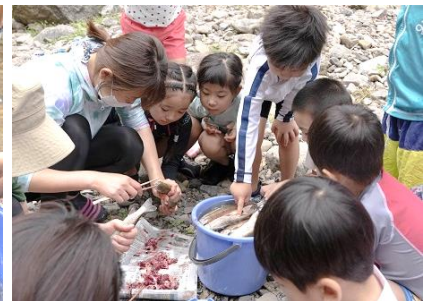
魚の腸（はらわた）取り