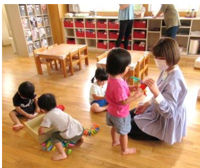
大学生保育所体験