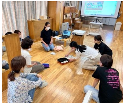
職員 AED・救命救急講習会