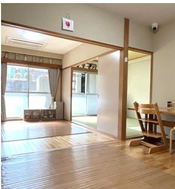
まるで小さな家のような 落ち着いた雰囲気です