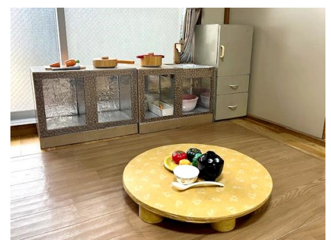
大人気の手作りキッチン コーナー