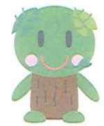
入広瀬地域イメージキャラクター 「ぶな菜ちゃん」

悪天候の場合は、大栃山『スポーツセンター』にて行い、ステージ・プログラム②を中止します。