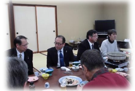
1月25日 商工会新年会 ～ご参加ありがとうございました～