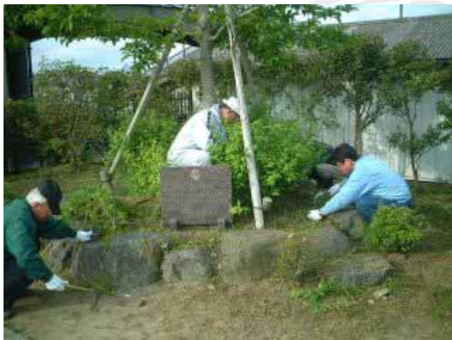
JR太田駅前の草取り

ちょっと参加者少なかった。小生も朝寝坊してすみません。 桃木の消毒、駅前の雑草取り、ライオンズの森の清掃など、各班に分かれて無事終了しました。